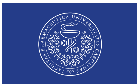
100 % – 60 % a ekvivalent negativní provedení