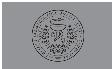
50 % – 10 % a ekvivalent pozitivní provedení