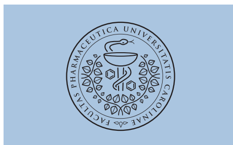
50 % – 10 % a ekvivalent pozitivní provedení

Při aplikaci na podkladovou plochu tmavší než 50 % K je třeba použít negativní provedení znaku.