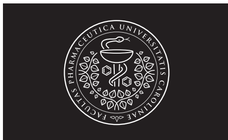
100 % – 60 % a ekvivalent negativní provedení